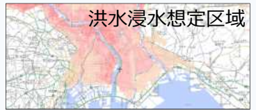
洪水浸水想定区域