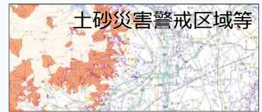
土砂災害警戒区域等