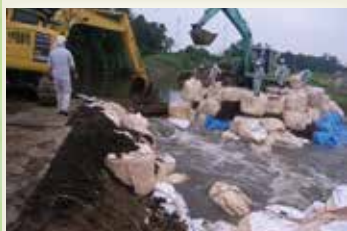
大きく決壊した箇所に大型土のうを設置して止水作業