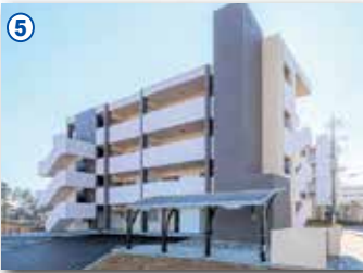
5 都和アパート(土浦市)