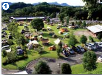
1 大子広域公園オートキャンプ場(大子町)

茨城県魅力ある建設事業推進連絡会議（CCI茨城）は、平成4年に設立され、「建設業のイメージアップ」と「職場環境の改善を図り、建設業が担う社会基盤整備の円滑な推進を図ること」を目的に活動しております。