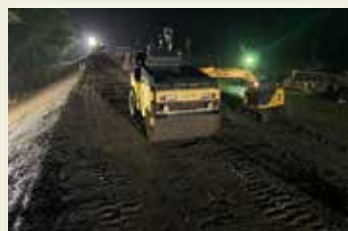
照明を設置し昼夜問わず復旧作業に取り組む建設業者