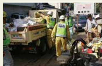
建設業協会員が集まり災害ごみの収集等ボランティア活動を行った