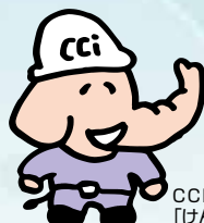
CCIキャラクター 「けんたくん」