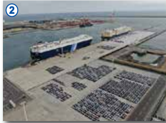
2 茨城港(常陸那珂港区中央ふ頭地区)