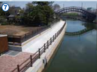
7 一級河川前川(潮来市)