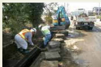
U字溝のふたを開け、小型バックホウと手作業で土砂をかき出す