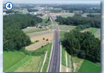
4 茨城空港アクセス道路(小美玉市)