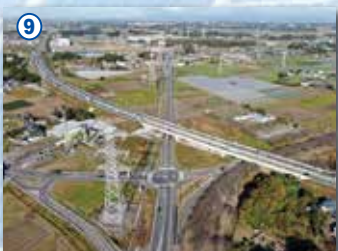
9 国道354号境岩井バイパス(坂東市)