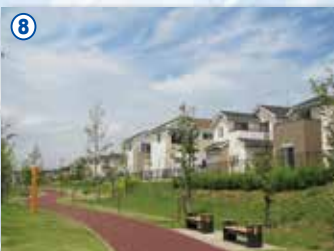
8 圏央道阿見東IC周辺開発(阿見町)