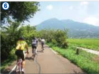
6 つくば霞ヶ浦りんりんロード