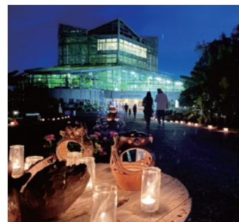
インスタ最優秀賞『ナイトガーデン』

本会と建設未来協議会は、令和5年度いばらき「建設フォトコンテスト」の入賞48作品を決定しました。最優秀賞3作品、特選12作品、準特選2作品、U22特別賞1作品、入選30作品です。