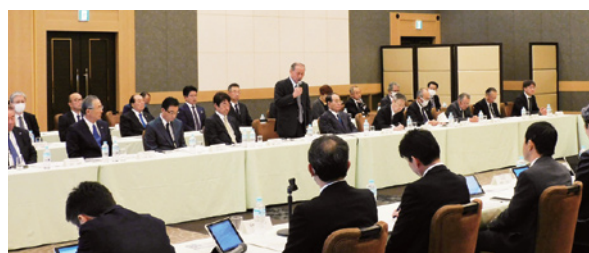
生産性向上や働き方改革などで意見を交わしました

あいさつで関東整備局の藤巻浩之局長は、9月の台風被害への対応に感謝の意を表し、「必要な施策のためにも必要な予算を確保していきたい。時間外労働の上限規制にも対応していく。生産性の向上と担い手の確保にも努めたい」と強調。