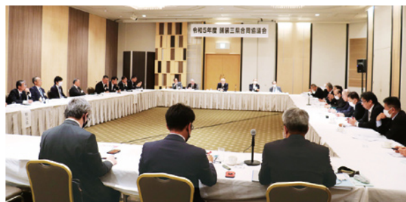
舗装に関する課題を協議しました

その後、道路予防保全工事（栃木県提案）、県発注工事における週休2日制の状況（群馬県提案）、労働時間の短縮（本県提案）について協議。