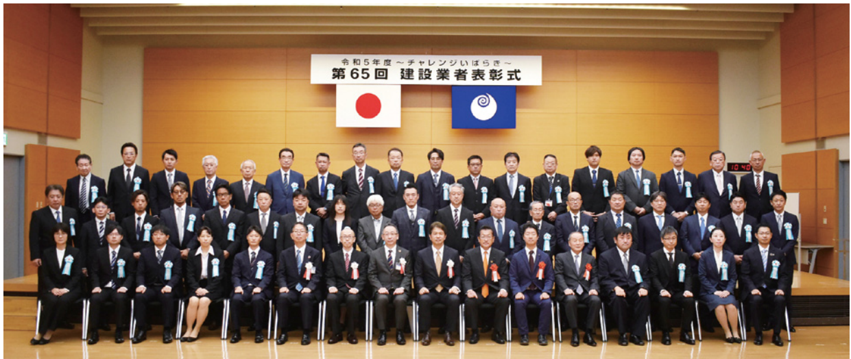
優良施工を行った建設業者や技術者が受賞しました

茨城県は10月31日、令和5年度「～チャレンジいばらき～第65回建設業者表彰式」を水戸市の県庁舎講堂で行いました。栄えある受賞者は37社（2JV）10名。知事表彰建設業者10社、知事表彰主任（監理）技術者5名、知事特別賞表彰「DX賞」5名、知事特別賞表彰「若手・女性技術者活躍賞」5人、農林水産部長表彰4社、土木部長表彰12社、企業局長表彰4社です。まことにめでたうございました。