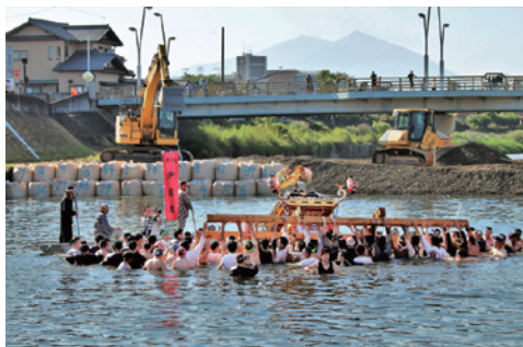
A部門最優秀賞『共演』