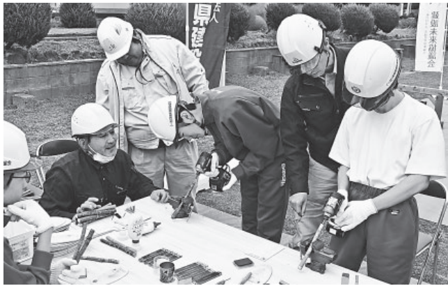
木製ハガキや鉛筆製作を体験した ※個人情報保護のため一部加工