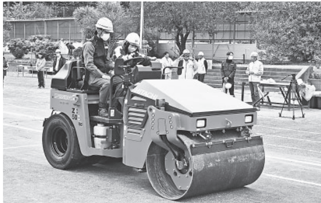
会員とともに重機を操縦