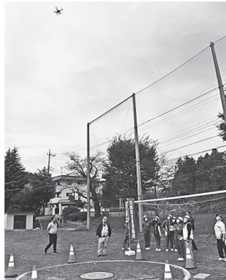
ドローン操縦を体験