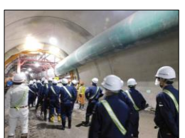
(仮称) 上曽トンネル本体工事 (石岡工区)