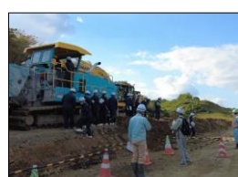
R3久慈川土砂改良(その2)工事