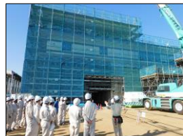
下妻市庁舎等整備工事