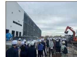
アルプレッサつくば物流センター新築工事