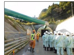
(仮称) 上曽トンネル本体工事 (石岡工区)