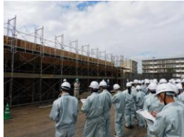
都和アパート17号棟建設工事