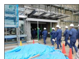
下妻市庁舎等整備工事