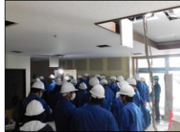
工第籍4501号萬春園建設事業建築工事 (仮称) 西部いきいき交流センター建設工事