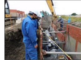
主要地方道結城坂東線 バイパス道路改良工事