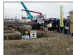
常総市 (仮称) 道の駅常総整備工事