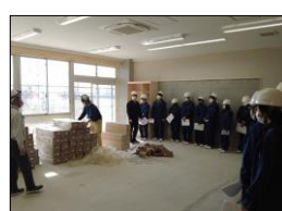
守谷市立守谷中学校校舎増築・改修工事