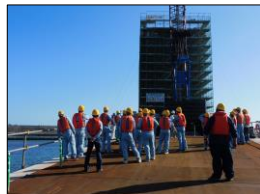
茨城港大洗港区水門上部工事