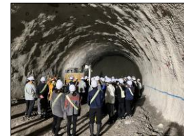
(仮称) 上曽トンネル本体工事 (石岡工区)