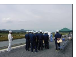
R2那珂川左岸小場地区下流築堤工事