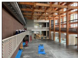
水戸市新市民会館等施設建築物新築工事 (仮称) 水戸芸術館東地区駐車場建設工事