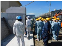
大津漁港海岸陸間・防潮堤整備工事 (その1)