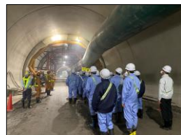
(仮称) 上曽トンネル本体工事 (石岡工区)