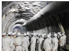
(仮称) 上曽トンネル本体工事 (桜川工区)