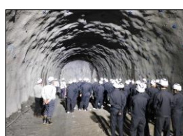
(仮称) 上曽トンネル本体工事 (桜川工区)