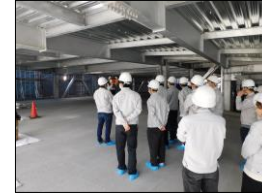
(仮称) 水戸芸術館東地区駐車場建設工事