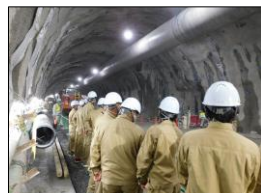
(仮称) 上曽トンネル本体工事 (桜川工区)