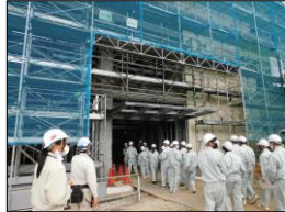
下妻市庁舎等整備工事