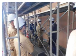
アクアワールド大洗 外壁塗装改修第3期工事