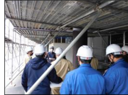
アクアワールド大洗 外壁塗装改修第3期工事

農業工学科 環境デザインコース 【2年生 3名】【3年生 5名】 【教員 1名】