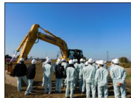
R3那珂川右岸中大野地区築堤工事