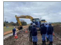
R3那珂川右岸下大野地区築堤工事