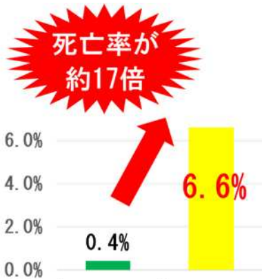
シートベルト等 着用有無別死亡率