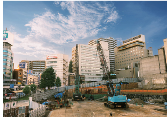
A部門最優秀賞「夢の続き」

本会は、いばらき「建設フォトコンテスト」の入賞作品50点を決定しました。最優秀賞4作品、特選12作品、準特選2作品、U22特別賞2作品、入選30作品。