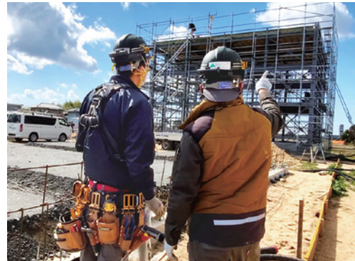
B部門最優秀賞「未来を描く」

上位の入賞作品はホームページに掲載しましたほか、本会の令和7年カレンダーにも採用します。