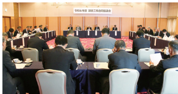
3県の課題解決へ協議しました

提案事項では、本会舗装部会が「舗装切断の際に発生する汚泥の処理」を質問。群馬県、栃木県ともに状況の把握はできていないものの、適切な