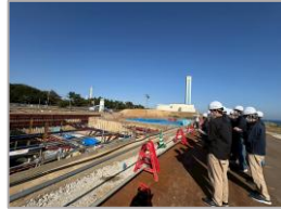
銚田・大洗広域事務組合 新ごみ処理施設建設工事