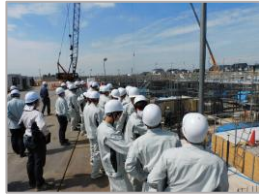
(仮称) みらい平地区 新設中学校建設工事