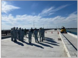
R 5 国道51号神宮橋架替 鹿嶋側橋梁上部工事