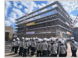
令和7年度 鹿島港外港地区 南防波堤他本体工事