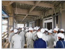
情報テクノロジー大学校 (仮称) 新棟新築工事