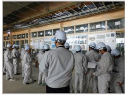
(仮称) 中根・金田台地区 小学校建設工事