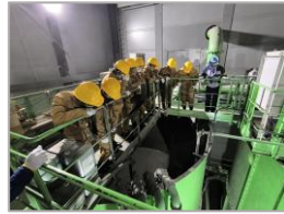
R 5 霞ヶ浦導水石岡トンネル (第5工区) 新設工事