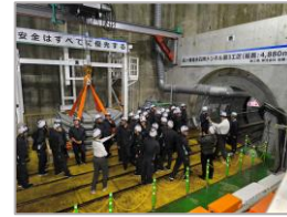
R 5 霞ヶ浦導水石岡トンネル (第3工区) 新設工事