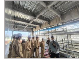
情報テクノロジー大学校 (仮称) 新棟新築工事