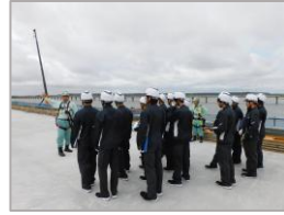
R 5 国道51号神宮橋架替 鹿嶋側橋梁上部工事