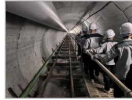
R 5 霞ヶ浦導水石岡トンネル (第5工区) 新設工事