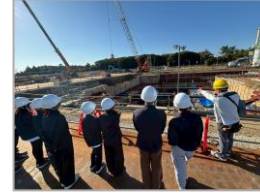
銚田・大洗広域事務組合 新ごみ処理施設建設工事