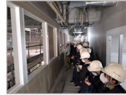
情報テクノロジー大学校 (仮称) 新棟新築工事