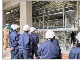
銚田市立旭小学校校舎等新築工事