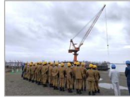
令和7年度 鹿島港外港地区 南防波堤他本体工事