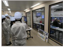
R 5 霞ヶ浦導水石岡トンネル (第5工区) 新設工事