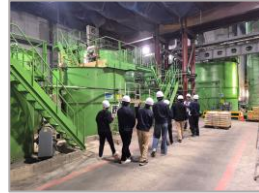
R 5 霞ヶ浦導水石岡トンネル (第5工区) 新設工事