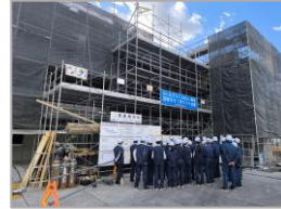
桜川西アパート106号棟建設工事 桜川西アパート107号棟建設工事