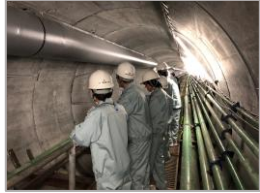
R 5 霞ヶ浦導水石岡トンネル (第5工区) 新設工事