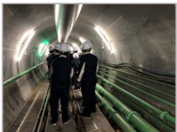
R 5 霞ヶ浦導水石岡トンネル (第3工区) 新設工事