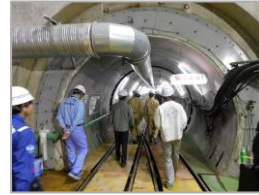
R 5 霞ヶ浦導水石岡トンネル (第3工区) 新設工事