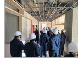
(仮称) 中根・金田台地区 小学校建設工事