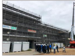
(仮称) 中根・金田台地区小学校建設工事