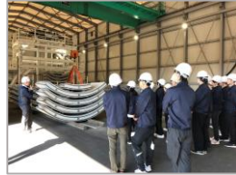
R 5 霞ヶ浦導水石岡トンネル (第3工区) 新設工事