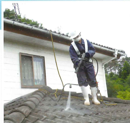
東日本大震災に係る除染作業に従事する組合 員企業の資金繰りがこの制度を通じて改善 されました(福島)