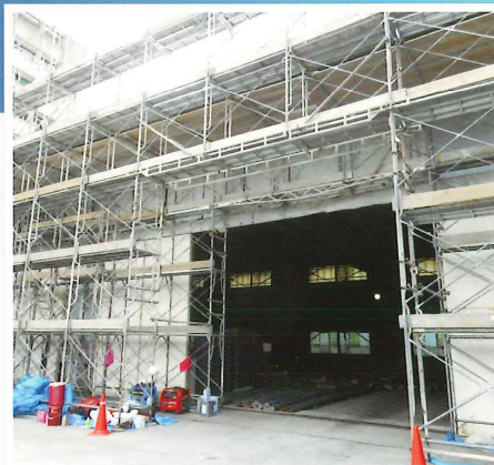
地元にとって必要不可欠な鉄筋の加工工場の 改修に活用されました(沖縄)