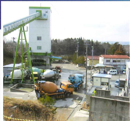
東日本大震災の復旧・復興工事に必要な生コン プラント関連施設建設に活用されました(福島)