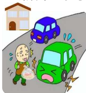
自宅近くでも油断禁物! 横断歩道を渡りましょう!