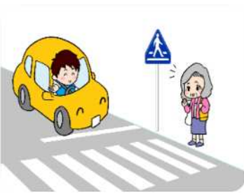
横断歩道は歩行者優先!