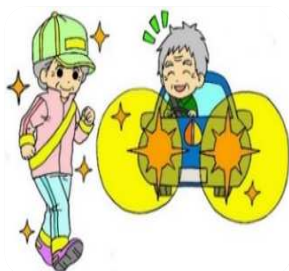
夜間は自分の存在をアピールする反射材の着用!