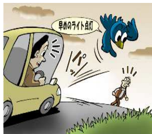
早めのライト点灯!